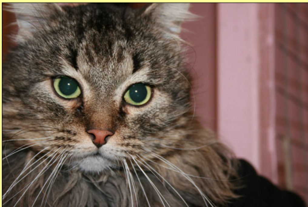
Stilige Tuffing är en av de ursprungligen 26 katter som kom från Ormsta till Solgläntan.

TEXT & FOTO: ©LENA ENGEN, ORDFÖRANDE I KATTFONDEN lena@kattfonden.se