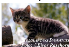
SOLGLÄNTANS DAMMTUSS