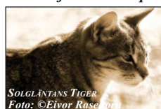
SOLGLÄNTANS TIGER