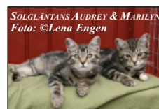
SOLGLÄNTANS AUDREY & MARILYN