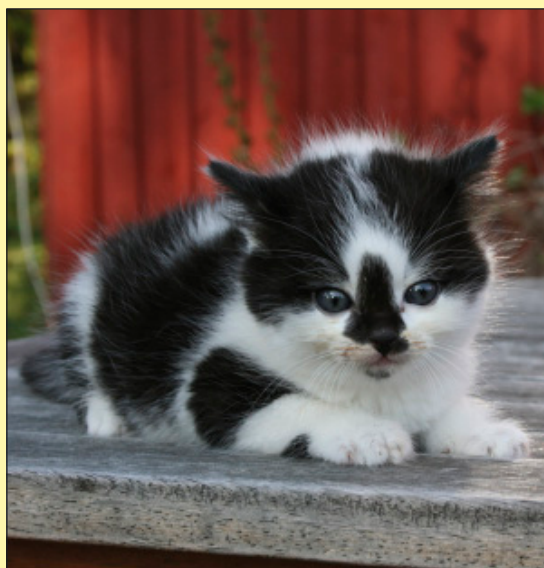
LouLou som en jägare hittade övergiven i skogen och som han inte ville skjuta utan lämnade in henne på Solgläntans katthem.

TEXT & FOTO: ©LENA ENGEN, ORDFÖRANDE I KATTFONDEN lena@kattfonden.se