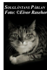
SOLGLÄNTANS PÄRLAN