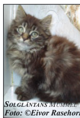
SOLGLÄNTANS MUMMEL