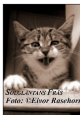
SOLGLÄNTANS FRÅS

Tröjorna i 100 % bomull kommer från www.axonprofil.se