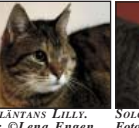
SOLGLÄNTANS LILLY.