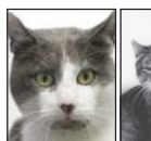
SOLGLÄNTANS TJOCKIS.