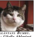
SOLGLÄNTANS BUMBY.