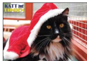
SOLGLÄNTANS ERNST. 18 x 11,7 cm. Dubbelvikt.

Tröjorna kommer från www.nlt-scandinavia.se