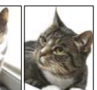
SOLGLÄNTANS MISSY.