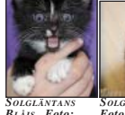
SOLGLÄNTANS ERNST. 18 x 11,7 cm. Dubbelvikt.