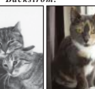
SOLGLÄNTANS MIMMI & SNUTTAN II.