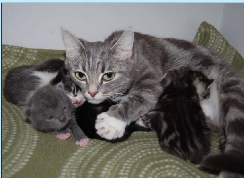
Misty med sina kattungar.

gläntan kommer i första hand att vara här på måndagar och torsdagar . Vi vill förutom att kunna behandla våra egna katter även kunna ta emot externa kattpatienter och också hinna med att göra hembesök.