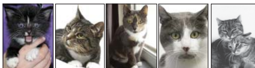
SOLGLÄNTANS BLÅS. Foto: ©Lena Engen Bäckström. SOLGLÄNTANS MYS PRS. Foto: ©Eivor Rasehorn. SOLGLÄNTANS MISS. Foto: ©Lena Engen Bäckström. SOLGLÄNTANS TROGIS. Foto: ©Eivor Rasehorn. SOLGLÄNTANS MIMMI & SNUTTAN II. Foto: ©Eivor Rasehorn.

eller info@kattfonden.se och OM DU KÖPER TRÖJA OCH VYKORT SAMTIDIGT BLIR PORTOT HÖGST 42 KR OAVSETT ANTAL.